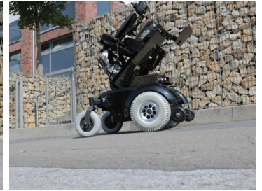
Abgebildetes Model: TA Indoor Wave