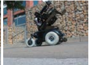
Abgebildetes Model: TA Indoor Wave