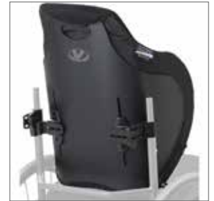
VL ICON-Back Deep