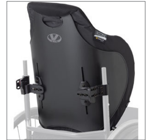
VL ICON-Back Deep