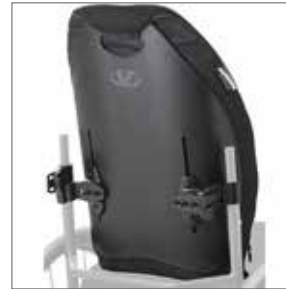
VL ICON-Back Tall