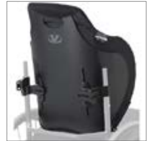
VL ICON-Back Deep