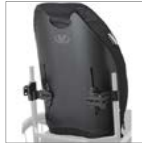
VL ICON-Back Tall